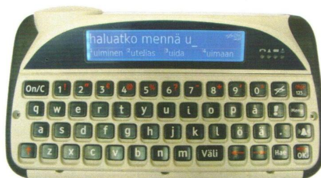
Bild 3. Kommunikationsapparat med tangentbord och inbyggd ordbok

Apparater med tangentbord kan användas för att skriva ut enstaka ord eller längre meningar som apparaten sedan talar ut med inbyggd talsyntetisator. De är enkla att använda, men de kräver att användaren kan läsa och skriva och att användaren uppfattar hur man ska använda knapparna på apparaten. Många gånger har apparaterna också en funktion för att hjälpa med skrivandet. Man kan ha en lista över ord som man ofta använder och man har oftast också inbyggd ordbok som ger förslag på olika ord när användaren börjar skriva [3]. Bild 3 visar exempel på hur en sådan apparat kan se ut.