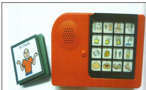
Bild 2. Talapparat med ett meddelande (vänster) och talapparat med flera meddelanden(höger)

Talapparater kan bli uppdelade i två grupper. Den ena är apparater som bara har ett meddelande i minnet åt gången och den andra är apparater som har flera meddelanden i minnet åt gången. Bild 2 visar hur apparaterna kan se ut. I ett-meddelandeapparater förlorar man det tidigare meddelandet varje gång man lagrar in ett nytt meddelande. Sådana apparater är lätta att använda och fungerar bra när det gäller att spara korta önskningsar eller uttryck[3].