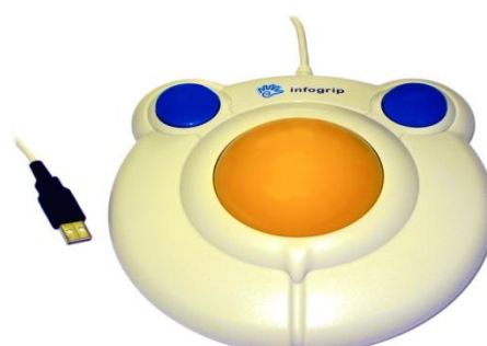
Bild 4. HeadMouse Extreme huvudstyrd mus (övre) och BIGtrack styrkula (nedre)

När man väljer tangentbord har man också alternativ att välja mellan enligt användarens behov. Det finns många olika former och storlekar. Vissa tål till och med fukt. Ibland, om användaren ändå är så högt fungerande att han eller hon klarar av att använda ett vanligt tangentbord, kan man fortfarande ha behov av specialmjukvara eller extra tillbehör för användningen av tangentbordet. Till exempel kan man ha en skyddsplatta som förhindrar oönskade tangenttryck. Man kan i operativsystemet ändra tecknens repetitions hastighet och man kan ha filtrering av teckenrepetition, så att alla oönskade tryckningar utelämnas. Det finns också programmerbara styrplattor som man kan använda som mus eller tangentbord. När man använder dem som tangentbord kan man själv